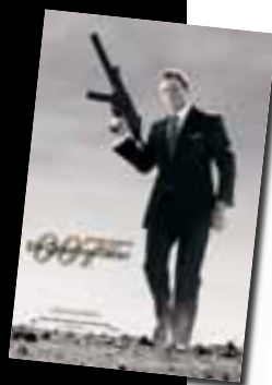
Ein grimmiger Daniel Craig alias James Bond – und immer mal wieder blitzt die Omega-Uhr unter der Manschette hervor.

sandro Palazzi weicht mich in das Geheimnis ein: im eisgekühlten Martini-Glas schwenkt er ein paar Tropfen extra trockenen Wermut, füllt es bis zum Rand mit in Eiswürfel geschwenktem Beefeater Gin auf und lässt das Öl von einem Stückchen Zitronenschale (von der Amalfiküste!) ins Glas tropfen. Fast zärtlich reibt er den